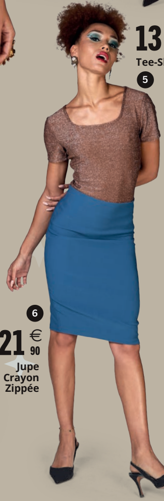
5 13 € 90 Tee-Shirt Lurex