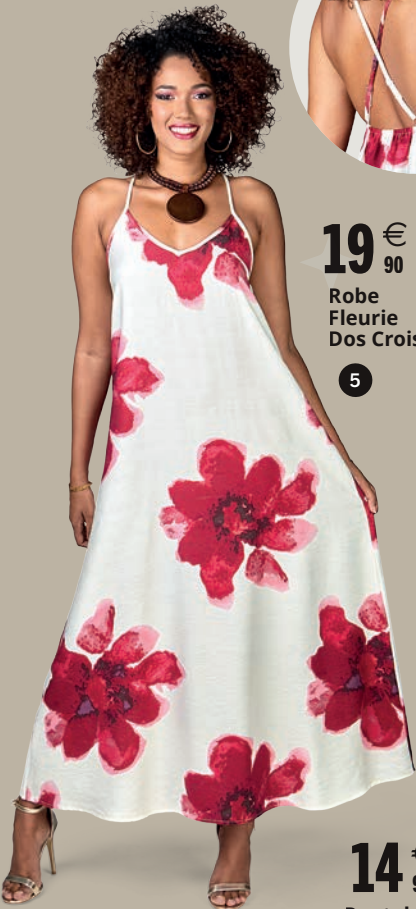
19 € 90 Robe Fleurie Dos Croisé 5