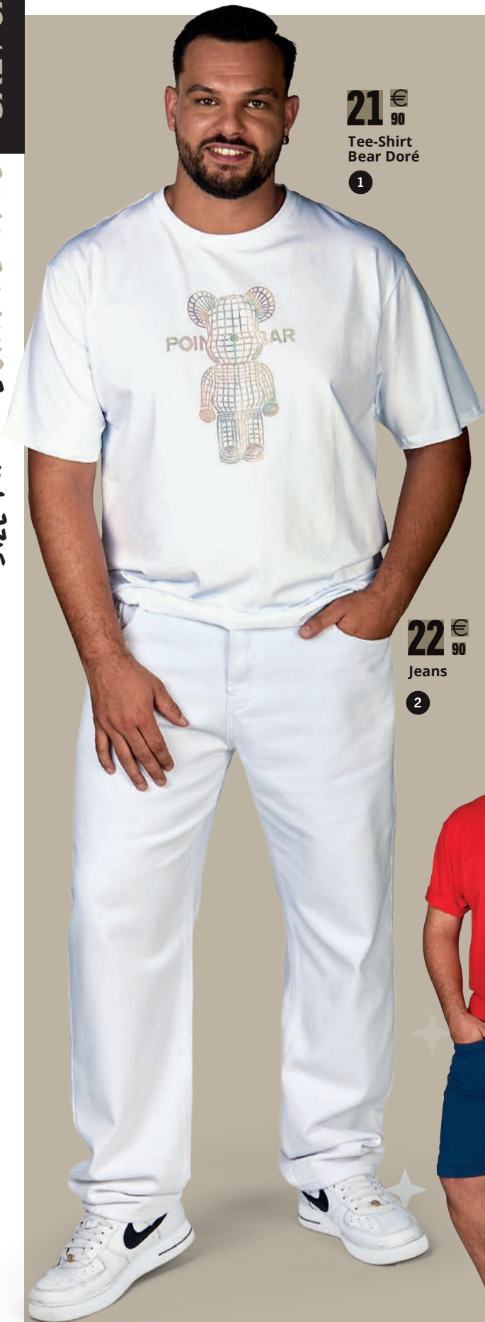
21 € 90 Tee-Shirt Bear Doré