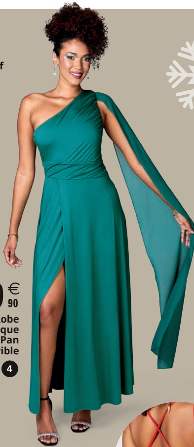
29 € 90 Robe Asymétrique Pan Amovible 4