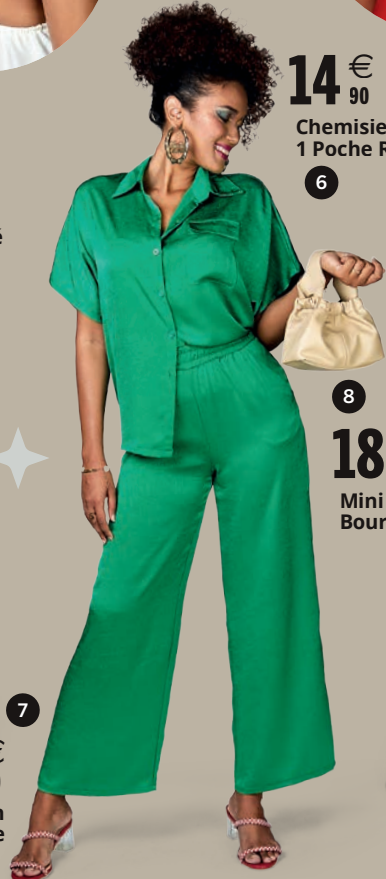
14 € 90 Chemisier 1 Poche Rabat 6