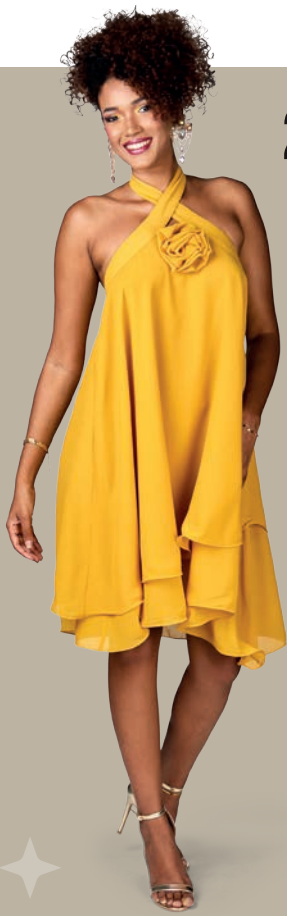
27 € 90 Robe Rose Relief 3