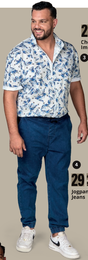
22 € 90 Chemise Imprimée