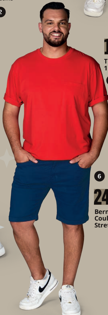
19 € 90 Tee-Shirt 1 Poche