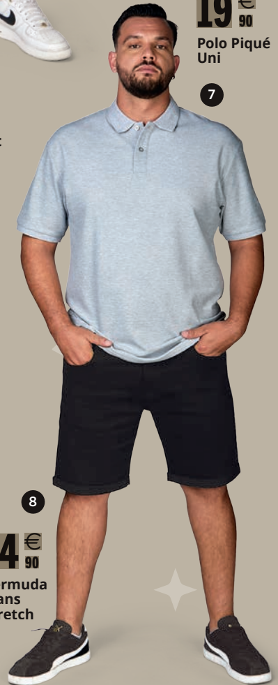
19 € 90 Polo Piqué Uni